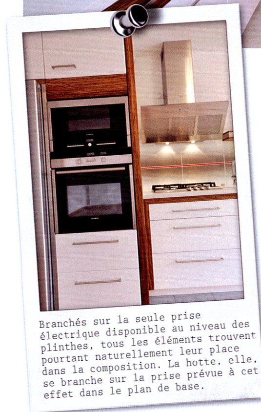
Branchés sur la seule prise électrique disponible au niveau des plinthes, tous les éléments trouvent pourtant naturellement leur place dans la composition. La hotte, elle, se branche sur la prise prévue à cet effet dans le plan de base.