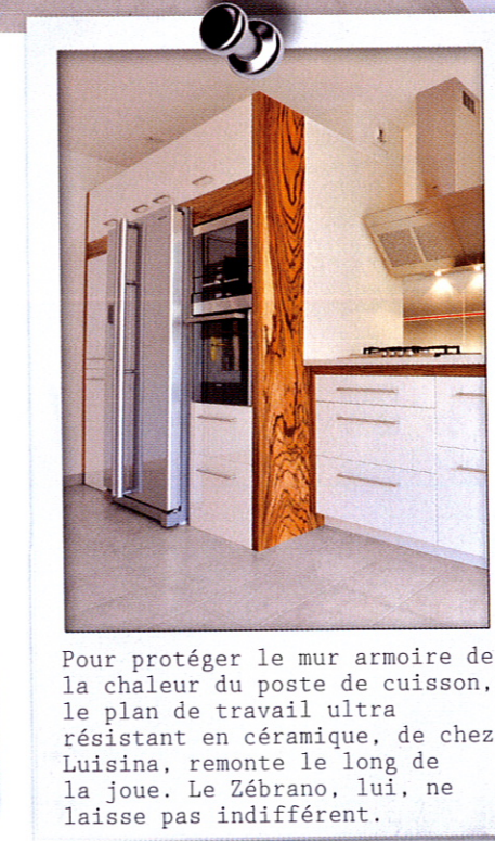
Pour protéger le mur armoire de la chaleur du poste de cuisson, le plan de travail ultra résistant en céramique, de chez Luisina, remonte le long de la joue. Le Zébrano, lui, ne laisse pas indifférent.