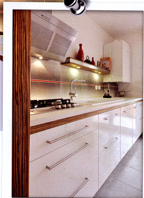
L'impossibilité d'intervenir sur les murs a contraint le cuisiniste à positionner la table gaz et le point d'eau côte à côte sans pour autant renier sur l'ergonomie.