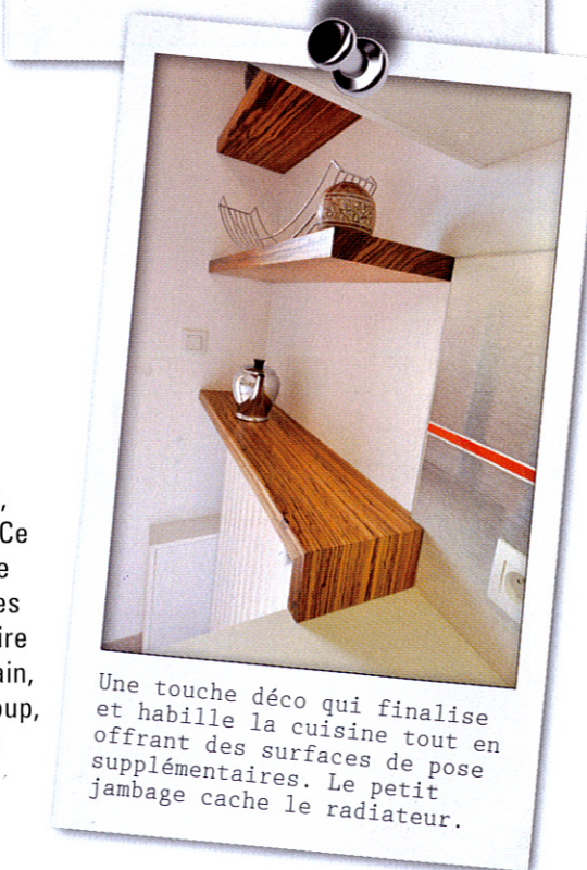
Une touche déco qui finalise et habille la cuisine tout en offrant des surfaces de pose supplémentaires. Le petit jambage cache le radiateur.